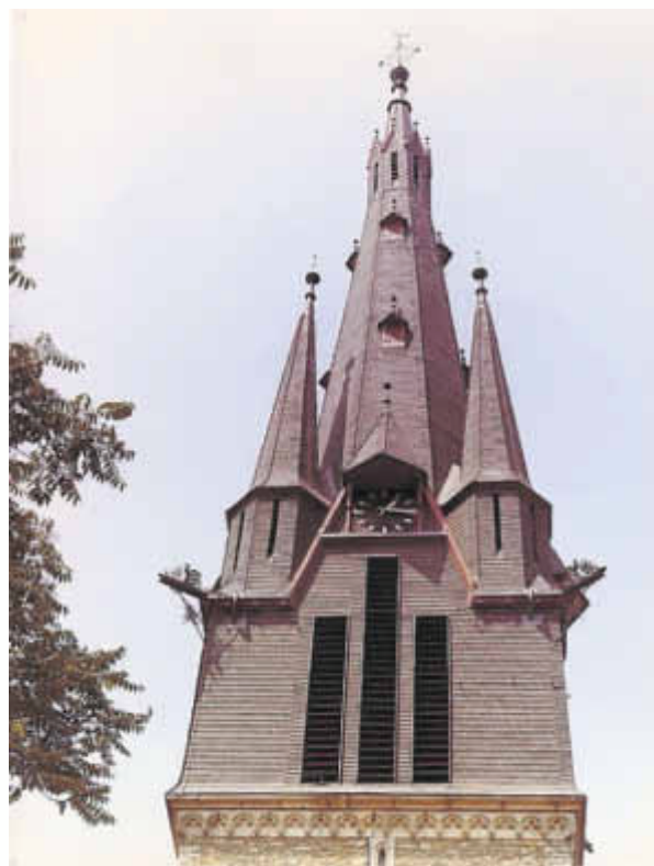
Bild 2: Foto Rübartsch Nr. 1476 vom 02.07.66 Quelle: Kath. Pfarrarchiv (KPA)

Das Kirchendach und der Kirchturm wurden neu eingedeckt, mit Eternitschiefer, „dabei erhielt die Turmuhr neue Zifferblätter“, so steht es in der von Karl Heinz Helm verfassten „Festschrift zur 1200-Jahrfeier“ (1966). So wie auf Bild 2 aus 1966 sehen sie auch heute noch aus, nach weiteren 46 Jahren.