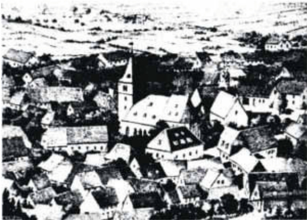
Bild 9: Ältestes Foto der Kirche um 1880

Ein älteres Uhrwerk, 1859 von der Firma Porth in Speyer geliefert, verkündete allein durch Stundenschlag die Zeit; es hatte keine Zeiger. Auf den ältesten Abbildungen aus dieser Zeit – noch vor dem Umbau der Kirche 1887-89 – ist erkennbar, dass der alte, niedrigere Turm keine Uhrzeiger hatte, vgl. Bilder 9 und 10.