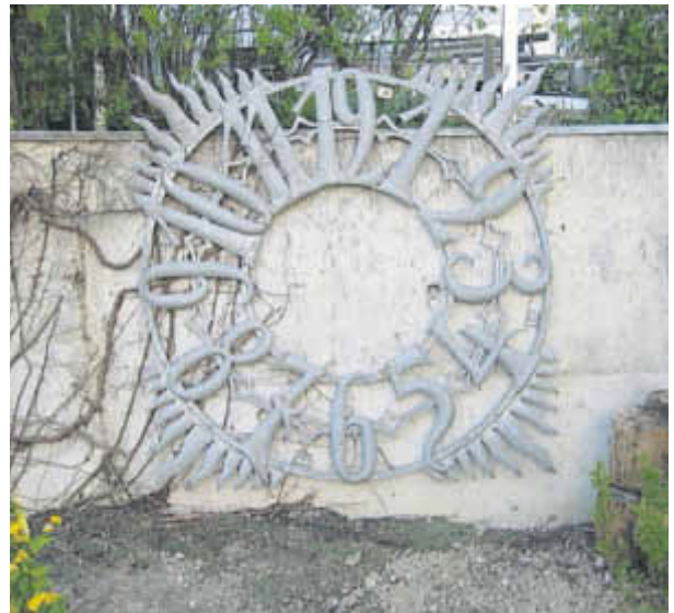
Bild 4: Zifferblatt im Garten Kirschenknapp

Doch nun zum Zifferblatt Nummer 4. Es lag im Keller von Schloss Ardeck, - im Schutt. Niemand kann sagen, wie es gerade dorthin gekommen ist. Damals war das Schloss zugleich der Sitz der neu gegründeten Verbandsgemeindeverwaltung. Und der an historischen Dingen interessierte Erich Hinkel, fand, wie er mir berichtete, 1980 das verbeulte Zifferblatt, lies es per Arbeitsbeschaffungsmaßnahme herrichten und dann an der Ostwand der Schulaula in der Schulstraße befestigen.