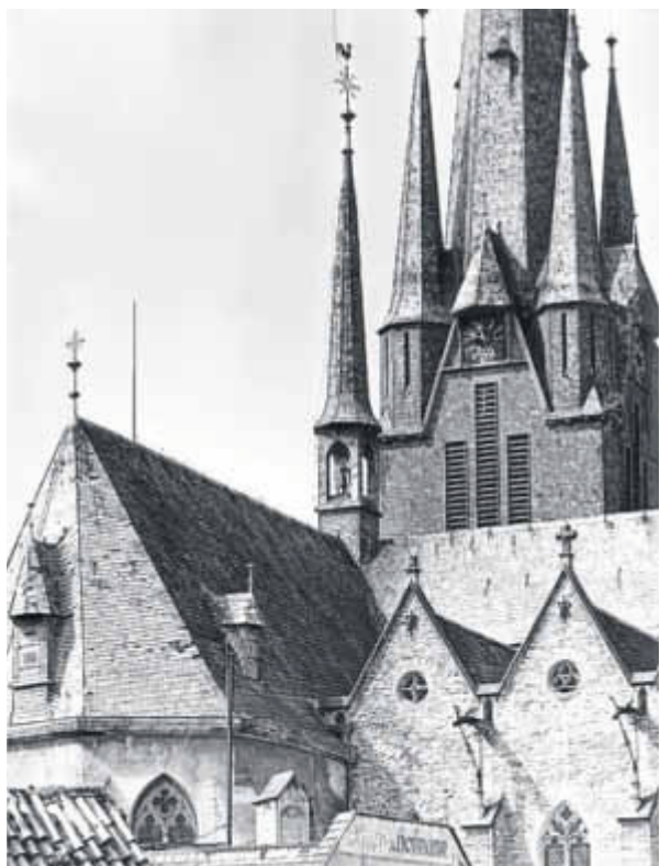
Bild 1: Nr 1032 vom 16.07.64

Zunächst waren sie bis 1965 am alten Platz. Bild 1 zeigt den Zustand vom Sommer 1964, noch mit der vorherigen Dacheindeckung und den alten Wasserspeiern am Seitenschiff, die im Jahr danach (1965) entfernt wurden.