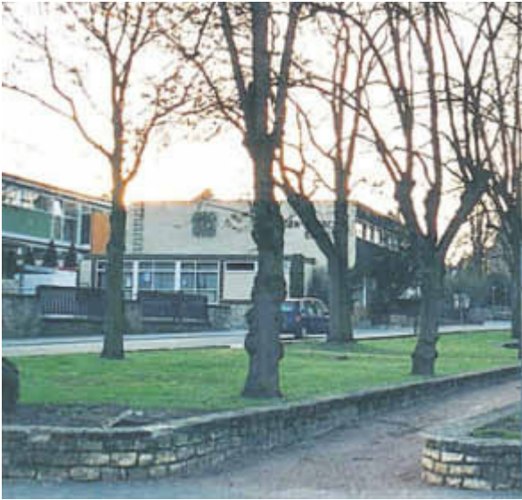
Bild 5: Zifferblatt an der Ostwand der Aula

auf dem im Hintergrund das Zifferblatt an der Wand zu erkennen ist neben der, von Bäumen leider etwas verdeckten, Schrift: Christian Erbach Schule, vgl. Bild 5.