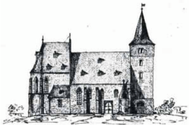
Bild 10: Kirche vor 1887, Zeichnung Kaplan May

Vermutlich mit dem Umbau des Kirchturmes 1889 sind dann wohl die Zeiger angebracht worden, von deren Schicksal ich gerade zuvor berichtet habe. Alte Rechnungen hierüber konnte ich bislang noch nicht auffinden. Jedoch, das alte Uhrwerk war nicht in der Lage, auch bei Sturm die Zeiger zu bewegen; sie waren alsbald zwecklos! Bis 1914. In diesem Jahr hatte die Civilgemeinde durch Beschluss des Stadtrates aus eigenen Mitteln mit einem Kostenaufwand von