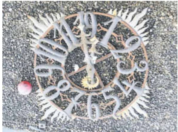
Bild 6: Zifferblatt auf dem Vordach der Aula