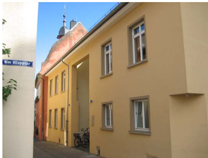
Außenansicht der Rathausscheune – Eingang Kreuzhof

In unmittelbarer Nähe auf dem Platz „Am Klopphor“ sind für Besucher ausreichend Parkmöglichkeiten vorhanden.