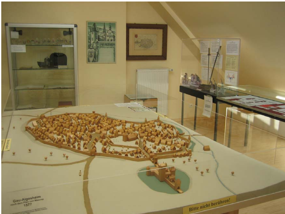
Der Raum der Geschichte mit dem Altstadtmodell

Die Fundbelege sind zwar spärlich zugleich jedoch auch informativ. Münzen und andere Gebrauchsgegenstände verdeutlichen den Lebensstandard der damaligen Siedler, die u.a. in den villae rusticae lebten, meist in der Nähe von Bachläufen. Ein weiterer zeitlicher Sprung führt zu den vorhandenen ersten schriftlichen Dokumenten aus der Geschichte des Ortes. Dazu zählt die Urkunde über eine Schenkung von Weinbergen aus dem Jahr 766 an das Kloster in Lorsch, woraus der Werbespruch „Wein seit 766“ der hiesigen Winzer entstanden ist. Die Verleihung der Stadtrechte im Jahr 1332 und deren Bestätigung im Jahr 1355 ist ebenfalls dokumentiert und zugleich kommentiert hinsichtlich der Wirkungsdauer dieser so genannten Frankfurter Freiheiten. Über 200 Jahre später ist die Stadt und ihre Umgebung durch Gotfried Mascop kartiert worden. Auf der Grundlage dieser Vorlagen aus dem Jahr 1577 ist das maßstabsgetreue Modell der mittelalterlichen Stadt Gau-Algesheim von Dr. Michael Kemmer geschaffen worden, das in der Mitte des Raumes steht.