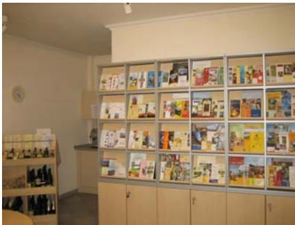
Weinregal u. Prospektwand im Tourismus-Büro

Interessenten erhalten dort Auskünfte und Prospekte zu Gästewohnungen, Stadt-Führungen, Weinproben, Wanderwegen in der näheren und weiteren Umgebung sowie Hinweise auf Angebote benachbarter Gemeinden. Die Umsetzung von Vorgaben und Wünschen nach bestimmten Kriterien der Rheinessen-Touristik GmbH in Ingelheim brachte im Frühjahr 2008 die Anerkennung des touristischen Qualitätsmerkmals „i-Punkt“ des Deutschen Touristik-Verbandes (DTV); sie gilt zunächst bis Anfang 2011 und muss dann erneut beantragt werden.