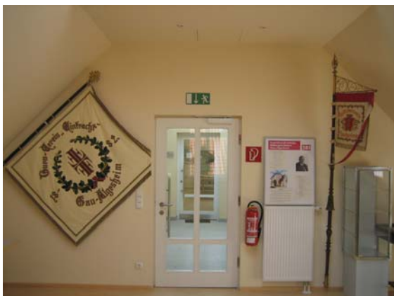
Fahnen und Auszeichnungen im Raum der Vereine

Dieser Raum wird bisher nur entlang der Wände von sich präsentierenden Vereinen genutzt, so dass die Freifläche im Innern des Raumes zur Zeit noch für weitere Nutzungen offen steht, so zum Beispiel für den Kleinkinder-Musikgarten der Volkshochschule Gau-Algesheim.