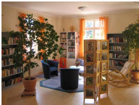
Die angenehme Atmosphäre des Leseraumes

Im Leseraum besteht eine Büchertauschbörse . Einwohner aus und Gäste in Gau-Algesheim haben Bücher unterschiedlicher Art in die Regale gestellt. Besucher können darin lesen und die Lektüre auch mit nachhause nehmen. Für Kinder ist ein eigener Bereich eingerichtet mit entsprechenden Leseangeboten und mit Spielsachen.