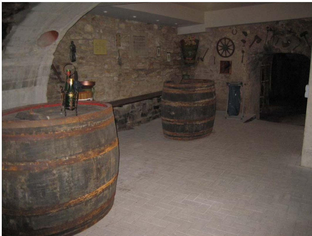
Der Keller der Rathausscheune

Die andere Hälfte des Kellers, heute mit der Kellerstation des Aufzuges, ist hergerichtet worden für kleinere Empfänge oder andere Zusammenkünfte, etwa als „abschließender Tagesordnungspunkt“ oder zum überparteiischen Gedankenaustausch nach Sitzungen der parlamentarischen Gremien der Stadt oder auch anderer Institutionen in den Räumen der Rathausscheune oder des Rathauses. An den Wänden dieses Kellerteiles sind Zeugnisse erfolgreichen Winzerfleißes unserer Altvorderen installiert.