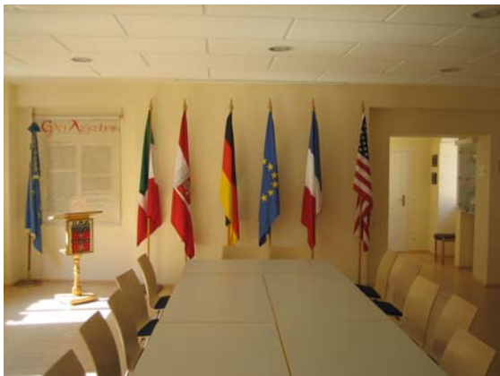
Der Multi-Media-Raum u.a. mit den Landesflaggen der Gau-Algesheimer Partnergemeinden

Der Raum wird betreut von der Gau-Algesheimer „Gesellschaft für internationale Verständigung“ (GiV). Diese wurde 1969 gegründet zur Förderung zunächst der deutsch-französischen Freundschaft mit der Aufgabe, die Menschen in Gau-Algesheim und dem burgundischen Saullieu näher zu bringen. Im Jahr 1972 wurde daraus eine Partnerschaft zwischen beiden Städten geschlossen. 1984 konnte dies ergänzt werden um eine Partnerschaft zwischen Gau-Algesheim und Caprino Veronese. 1990/1992 folgten die Beurkundungen der freundschaftlichen Beziehungen zwischen Gau-Algesheim und Redford, Michigan/USA. Ebenfalls 1990 wurde der Freundschaftskreis zwischen Gau-Algesheim und den beiden thüringischen Gemeinden Neudietendorf und Stotternheim beurkundet.