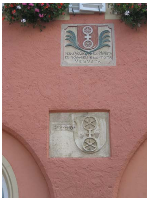
Widmungssteine des Gau-Algesheimer Rathauses

Heute ist im Erdgeschoss des Rathauses der Stadt der Amtssitz des Stadtbürgermeisters; er ist zugleich auch der Hausherr der Rathausscheune. Die Nutzung der Räume der Rathausscheune wie auch des Ratssaales im Rathaus erfolgt nach Maßgabe von Vorgaben des Rates der Stadt.